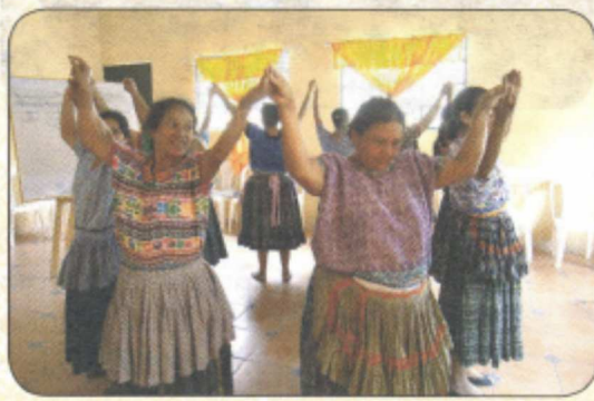
Se promovió el desarrollo organizacional y empresarial de artistas y artesanos mayas, con enfoque de equidad e inclusión social