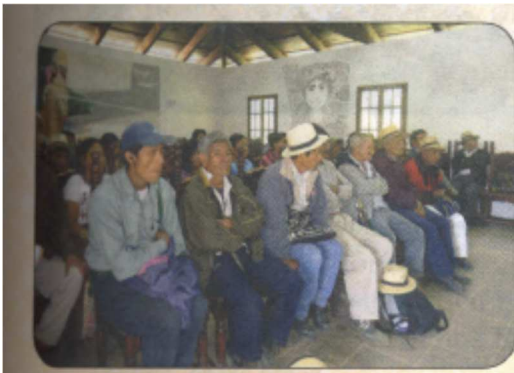
Participantes en la elección de representantes De la comunidad Maya Ixil ante el CODEDE De El Quiche

DIFUSION Y CONOCIMIENTO DE LA DIVERSIDAD CULTURAL: se promueve la interculturalidad y multiculturalidad, la equidad e inclusión, las industrias culturales, el turismo comunitario y otros temas relacionado con el desarrollo cultural. Así también, se coordinan investigaciones socioculturales sobre los elementos culturales de los pueblos maya, xinka, garífuna y ladino y se diseña material educativo y estrategias que contribuyan al fortalecimiento de la interculturalidad y el reconocimiento de la diversidad humana como riqueza para el desarrollo.