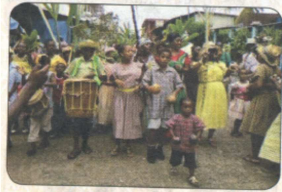
En 2012 se fortaleció la atención a la cultura garífuna

En 2012 se promovió el reconocimiento de la diversidad cultural, el fortalecimiento de las relaciones interculturales y la cultura de paz, mediante la organización de Festivales culturales intercomunitarios