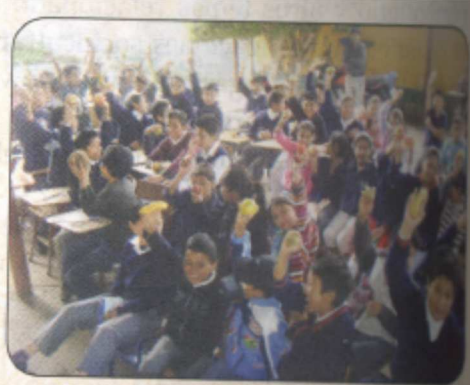
Se desarrollaron procesos de capacitación dirigidos a Docentes y estudiantes de diferentes niveles educativos sobre temas relacionados con participación ciudadana, diversidad cultural, multi e interculturalidad.